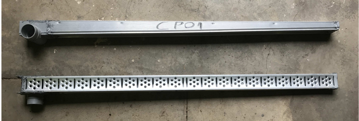
Fotografia 1 – Item 1287-17 após a realização dos ensaios

Laboratório de Instalações Prediais e Saneamento/ CETAC/ IPT