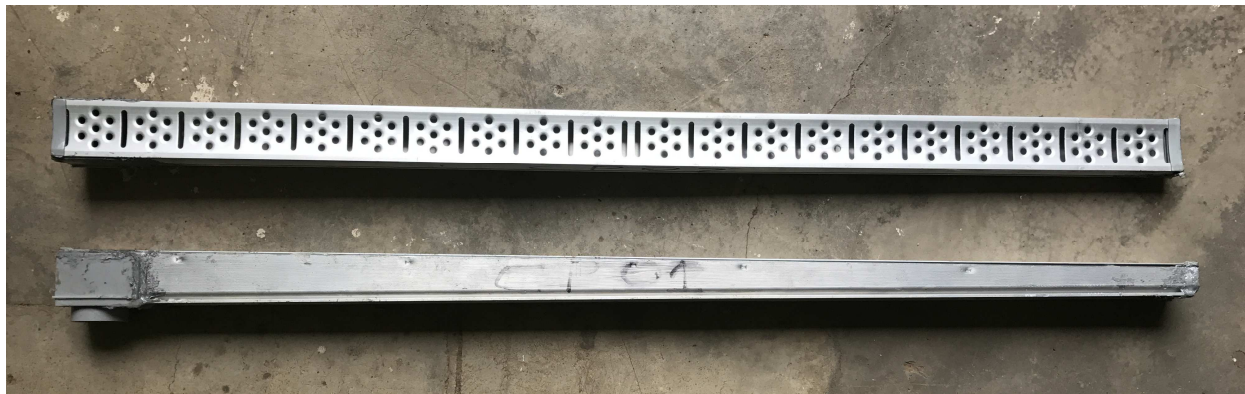
Fotografia 1 – Item 1288-17 após a realização dos ensaios

Laboratório de Instalações Prediais e Saneamento/ CETAC/ IPT