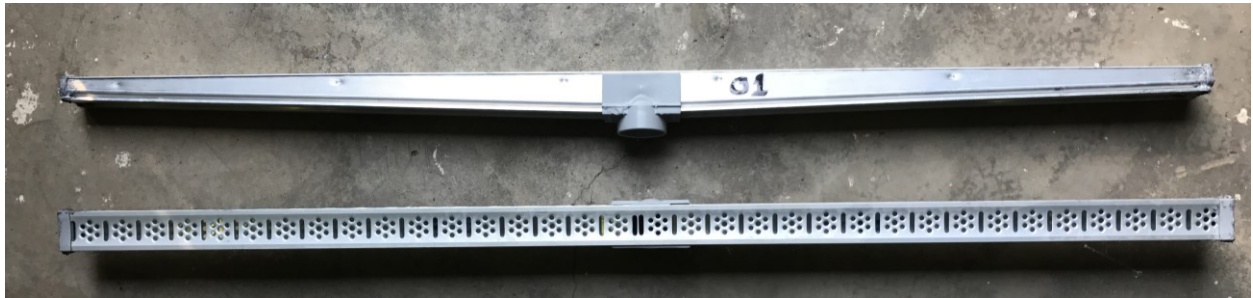
Fotografia 1 – Item 1286-17 após a realização dos ensaios